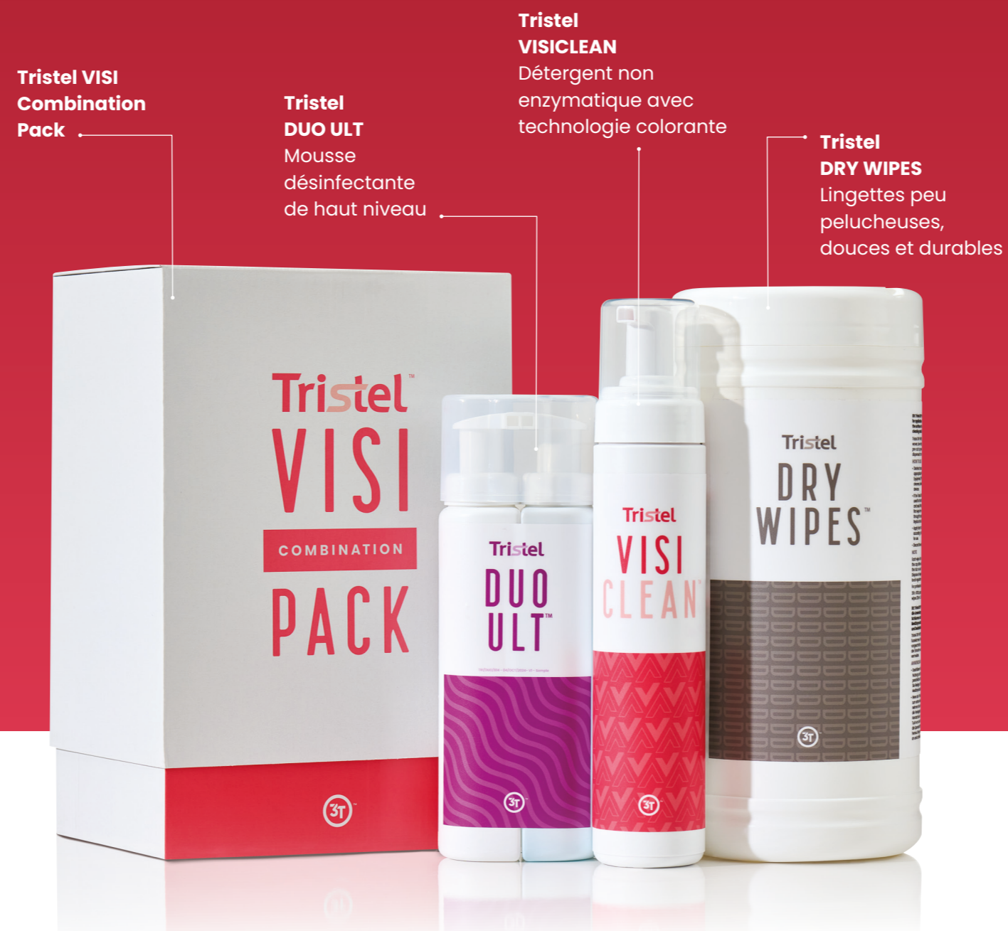
Tristel VISI Combination Pack

Tristel VISICLEAN est disponible dans le Tristel VISI Combination Pack qui permet de réaliser 155 procédures.